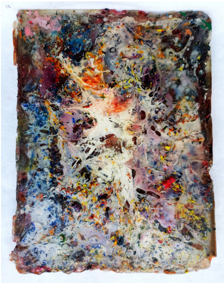
T. Greguol Silêncio 9, 2022 Técnica mista em resina. 35 x 26 cm